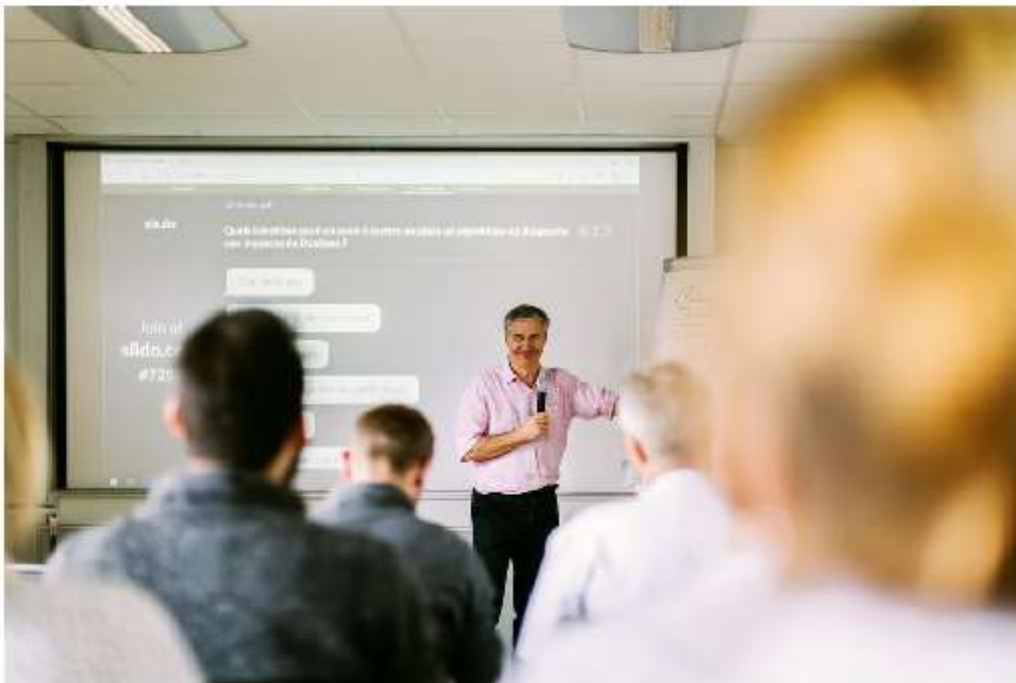
Au centre hospitalier de Doullens, le 27 mars Photo Marie Rouge

Par Eric Favereau, Envoyé spécial à Doullens. Photo Marie Rouge pour Libération ( http://www.liberation.fr/auteur/1848-eric-favereau ) — 29 avril 2018 à 20:36